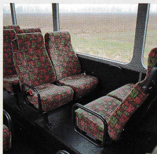
Gut erreichbare Sitze

Diese neue Variante des seit Jahren erfolgreichen Linienbusprogramms ist besonders fahrgastfreundlich. Über die stufenlosen Ein- und Ausstiege können alle Fahrgäste – auch Behinderte, ältere Leute und Mütter mit Kinderwagen – mühelos den Innenraum erreichen. Der Nutzen: Zeitsparender, reibungsloser Fahrgastfluß und damit mehr Attraktivität für den Überlandverkehr.